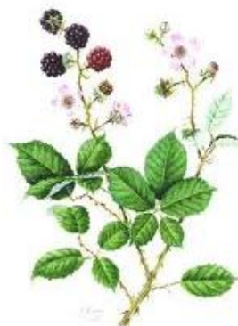
Blackberry (Rubus sanctus) Βάτος

The green husk is anodyne, antiparasitic and astringent. It is used in the treatment of diarrhea and anaemia. The leaves are used internally for the treatment of constipation, chronic coughs, asthma, diarrhea, dyspepsia.