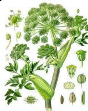
Angelica (Archangelica officinalis) Αγγελική

The berries are useful to cleanse and detoxify the blood, and in conditions of the intestines. The leaves, flowers and roots stop internal bleeding, are stomachic and lower blood sugar levels.