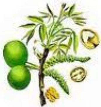
Walnut (Juglans Regia) Καρυδιά

The green husk is anodyne, antiparasitic and astringent. It is used in the treatment of diarrhea and anaemia. The leaves are used internally for the treatment of constipation, chronic coughs, asthma, diarrhea, dyspepsia.