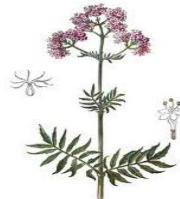
Valerian (Valeriana Off.) Βαλεριάνα

The root stalks, leaves and fruit possess carminative, stimulant, diaphoretic, stomachic, tonic and expectorant properties. A good remedy for colds, coughs, wind, colic, rheumatism and urinary conditions.