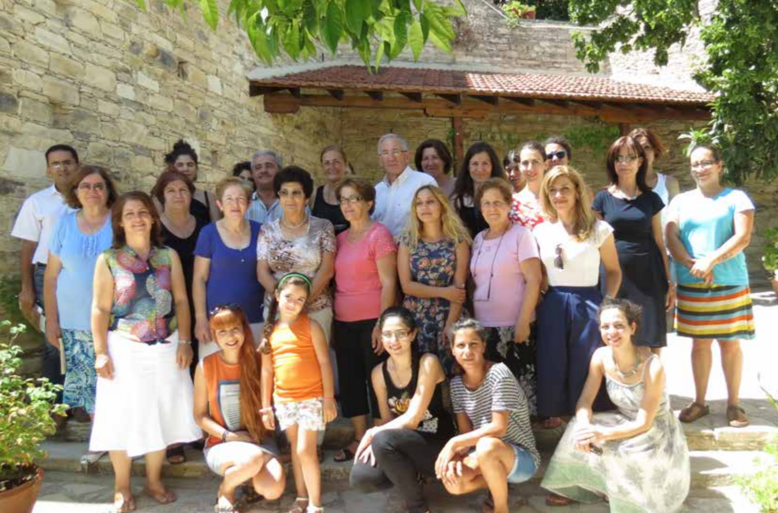
Ομαδική φωτογραφία