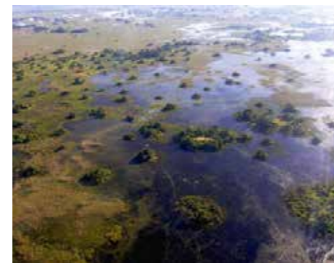
Okavango Δέλτα

συστήματα δέλτα χωρίς έξοδο στη θάλασσα, το οποίο, εξαιτίας των τεκτονικών μετατοπίσεων, εκβάλλει στην έρημο Καλαχάρι. Αποτελεί καταφύγιο σπάνιας ομορφιάς της αφρικανικής φύσης, το οποίο συγκεντρώνει τους τελευταίους μεγάλους πληθυσμούς άγριων ζώων που απειλούνται από εξαφάνιση, όπως ο αφρικανικός ελέφαντας, η ζέβρα, ο λευκός και ο μαύρος ρινόκερος, ο γατόπαρδος και το λιοντάρι της Αφρικής. Πρόκειται για ένα εξαιρετικό παράδειγμα της σχέσης μεταξύ κλιματικών, υδρολογικών και βιολογικών διεργασιών.