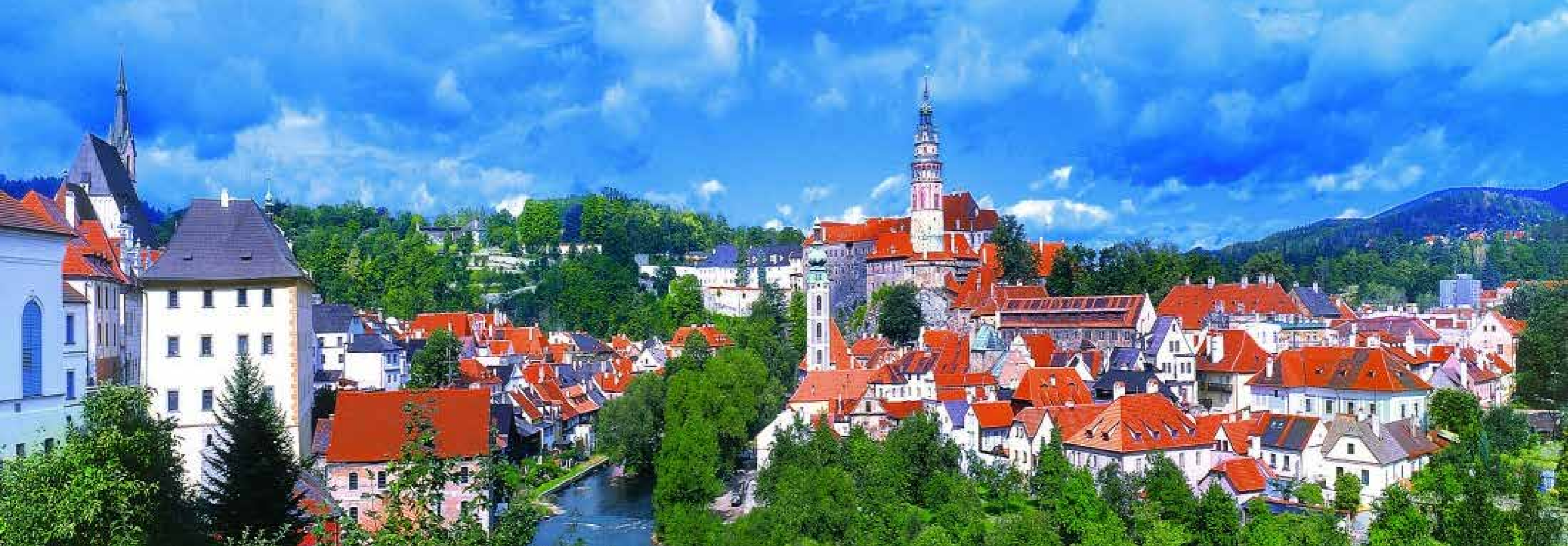
Ιστορικό κέντρο της μεσαιωνικής πόλης Český Krumlov που έχει ενταχθεί στον Κατάλογο Παγκόσμιας Κληρονομιάς της UNESCO