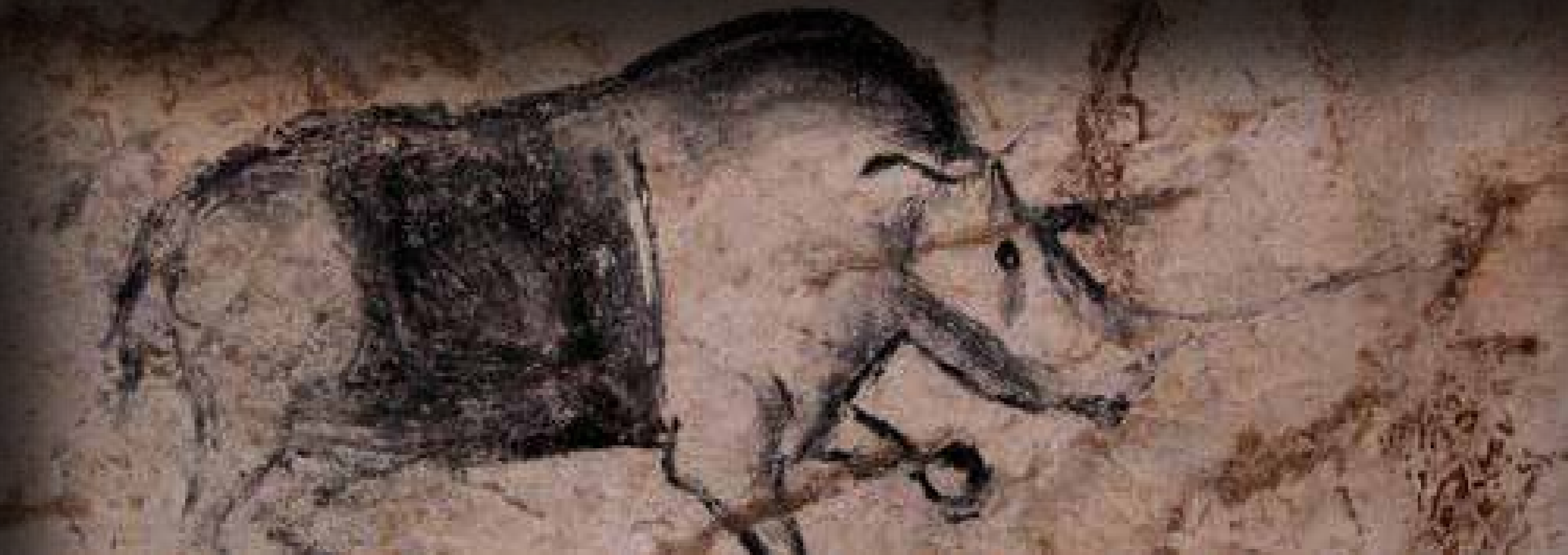
Σπήλαιο του Chauvet - Pont d'Arc