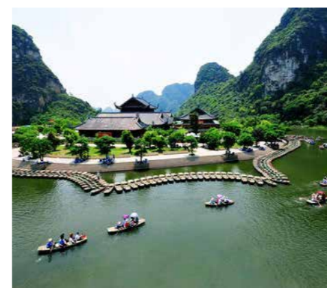
Trang An, Βιετνάμ

Το Trang An βρίσκεται στη νότια ακτή του Δέλτα του Κόκκινου ποταμού στο Βιετνάμ. Πρόκειται για ένα εντυπωσιακό νησί με καταπράσινες κοιλάδες και ασβεστολιθικά πετρώματα που σχηματίζουν καρστικά φαινόμενα, το οποίο περιβάλλεται από ογκώδεις, κατακόρυφους βράχους. Στις ψηλότερες από τις σπηλιές εντοπίστηκαν από τους αρχαιολόγους σημεία ανθρώπινης δραστηριότητας 30.000 χρόνων περίπου. Στο πανέμορφο αυτό τοπίο βρίσκονται επίσης ιεροί χώροι, όπως ναοί και παγόδες, χωριά και η πρώην πρωτεύουσα του Βιετνάμ κατά τον 10ο - 11ο αιώνα μ.Χ., η Hoa Lu.