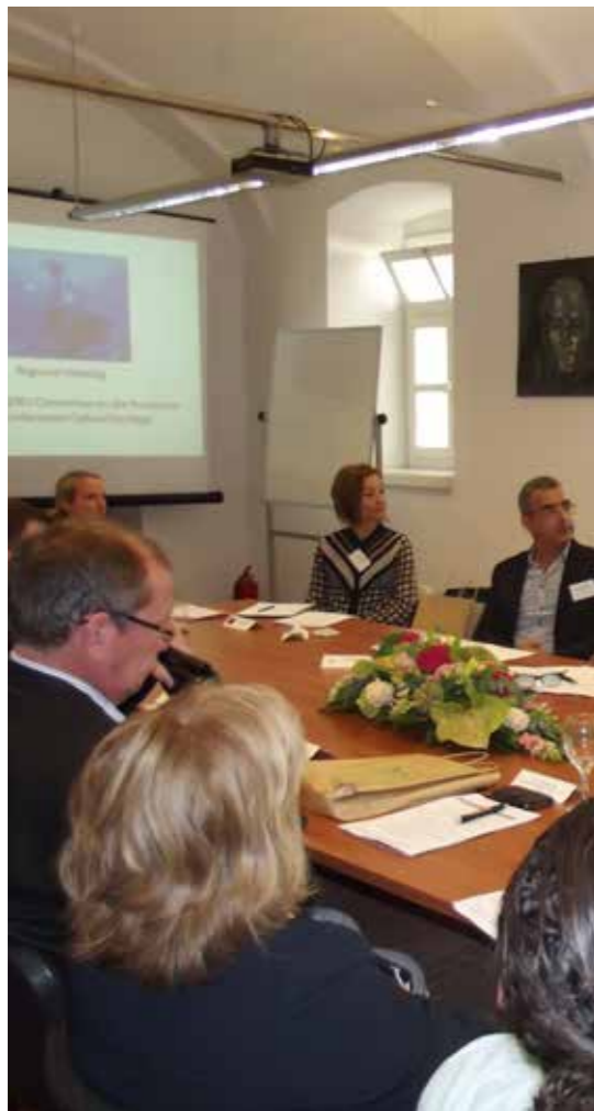
Συμμετέχοντες στη συνάντηση, στην αίθουσα συνεδριάσεων του Διεθνούς Κέντρου Ενάλιας Αρχαιολογίας στο Zadar