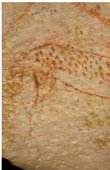
Σπήλαιο του Chauvet - Pont d'Arc

Το καταπράσινο δέλτα Okavango στη βορειοδυτική Botswana είναι ένας υγρότοπος στη μέση της ερήμου, που συνδυάζει ελώδεις εκτάσεις και εποχιακά πλημμυρισμένα λιβάδια. Είναι ένα από τα πιο μεγάλα εσωτερικά