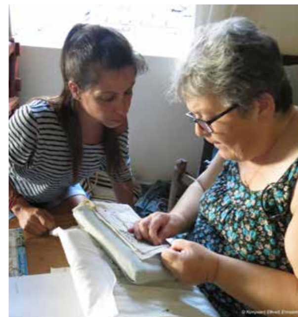
© Κυπριακή Εθνική Επιτροπή UNESCO / Α. Πολυμεική

Στη φετινή διοργάνωση συμμετείχαν 12 εκπαιδευόμενοι και 6 κεντήτριες. Ανάμεσα στους στόχους του προγράμματος ήταν η επιμόρφωση και ευαισθητοποίηση εκπαιδευτικών σχετικά με την προστασία και διάδοση της Άυλης Πολιτιστικής Κληρονομιάς της Κύπρου, η απόκτηση βασικών δεξιοτήτων κατασκευής Λευκαρίτικου κεντήματος και η δημιουργία προτάσεων αξιοποίησης της παραδοσιακής αυτής τέχνης στο μάθημα των εικαστικών τεχνών.