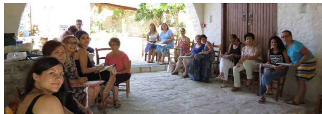
Ομαδικό μάθημα στην αυλή του τοπικού Μουσείου Παραδοσιακής Κεντητικής και Αργυροχοΐας

Τα μαθήματα ολοκληρώθηκαν την Παρασκευή, 29 Αυγούστου. Περισσότερες πληροφορίες για το πρόγραμμα μπορείτε να βρείτε στην ιστοσελίδα της Κυπριακής Εθνικής Επιτροπής UNESCO ( www.unesco.org.cy ).