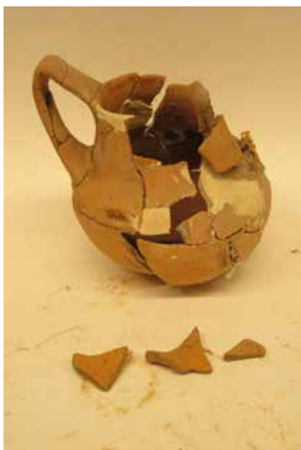
Κεραμικό αγγείο πριν και μετά τη συντήρηση

του Ηλία Κυριακίδη Συντηρητή Κεραμικών Αρχαιοτήτων στο Τμήμα Αρχαιοτήτων