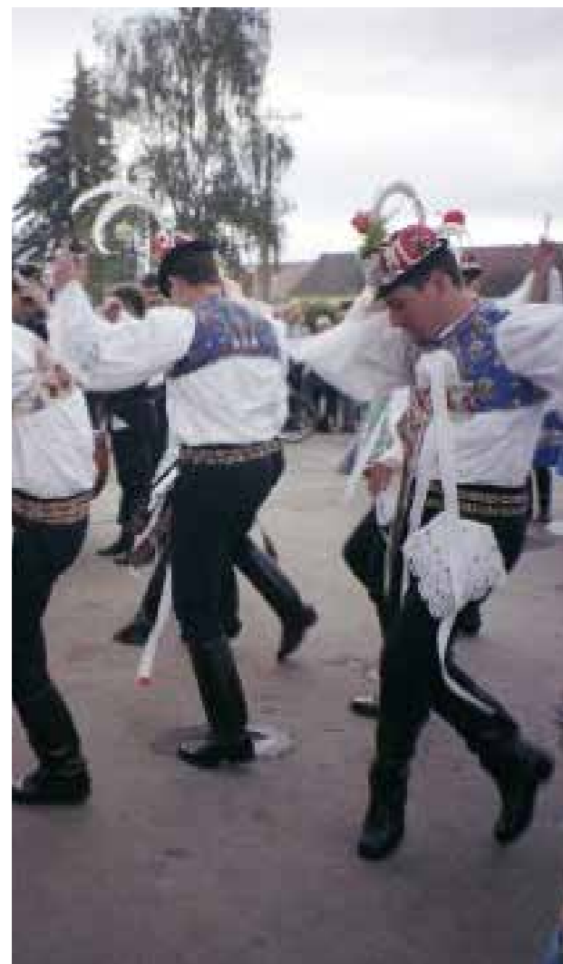
Χορός Slovácký Verbuňk

Το 1996 η Τσεχία εντάχθηκε στο παγκόσμιο δίκτυο Εταιρικών Σχολείων UNESCO (ASPnet). Από το 1997, η γραμματεία της Επιτροπής ανέλαβε τον συντονισμό των εθνικών προγραμμάτων που υλοποιούνται στα πλαίσια των δράσεων του δικτύου ASPnet, παρέχει στα σχολεία την απαραίτητη πληροφόρηση και ενθαρρύνει τη συνεργασία μεταξύ Εταιρικών Σχολείων της Τσεχίας με αντίστοιχα σχολεία στο εξωτερικό. Σήμερα το δίκτυο αριθμεί 50 σχολεία πρωτοβάθμιας και δευτεροβάθμιας εκπαίδευσης στη Τσεχία.