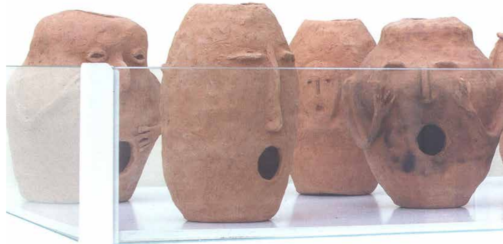
«Τάμα στον Άγνωστο Θεό», Susan Vargas © ex-Artis / Χαράλαμπος Χαράλαμπος