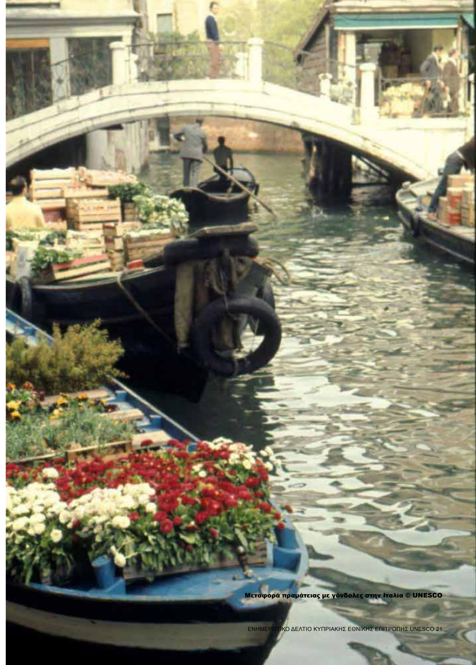
Μεταφορά πραμάτειας με γόνδολες στην Ιταλία