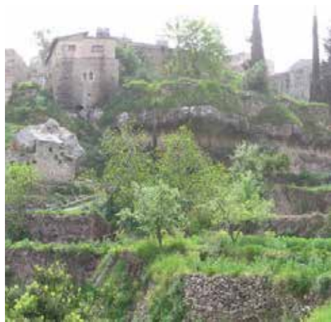
Παλαιστίνη: Πολιτιστικό Τοπίο Battir στη Νότια Ιερουσαλήμ