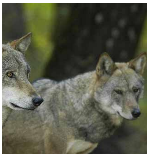
Δάσος Bialowieza

Το δάσος Bialowieza βρίσκεται στα σύνορα Πολωνίας και Λευκορωσίας και αποτελεί μια αχανή έκταση πρωτογενών δασών (141.885 εκτάρια) με κωνοφόρα και πλατύφυλλα δέντρα, βελανιδιές και πεύκα ηλικίας 600 ετών. Το δάσος είναι επίσης πλούσιο σε πανίδα, καθώς σε αυτό διαβιούν περίπου 1.600 είδη πεταλούδων, πολλά είδη ψαριών, έντομα, ερπετά και πουλιά. Στο δάσος Bialowieza προστατεύεται, μεταξύ άλλων ειδών, και ο ευρωπαϊκός βίσωνας, ένα είδος που παλαιότερα αφθονούσε στην ευρωπαϊκή ήπειρο και είναι σήμερα υπό εξαφάνιση. Ο βιολογικός κύκλος της ζωής και οι φυσικές λειτουργίες των ειδών, όπως παρατηρούνται στο Bialowieza, παραμένουν αναλλοίωτες στο χρόνο και πλέον το δάσος αυτό αναδείχθηκε σε κέντρο βιοποικιλότητας της Ευρώπης.