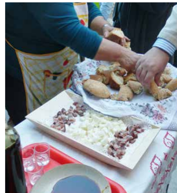
Γευσίγνωσία τοπικών προϊόντων στο χωριό Βουνί