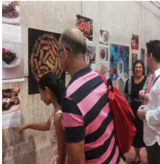
Τελετή Βράβευσης Διαγωνισμού Φωτογραφίας Μουσείου Κυπριακών Τροφίμων και Διατροφής