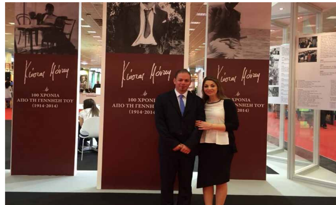
Αφιέρωμα στον Κώστα Μόντη στη Διεθνή Έκθεση Βιβλίου Θεσσαλονίκης (8-11 Μαΐου 2014) © Ίδρυμα «Κώστας Μόντης»

Η προώθηση του έργου του Κώστα Μόντη εκτός των συνόρων της Κύπρου δίνει στο νησί μας την δυνατότητα ανάδειξης του πολιτισμού μας, αλλά και των προβλημάτων που μαστίζουν τον τόπο μας. Δίνει επίσης την ευκαιρία στο έργο του Μόντη να αναγνωριστεί από ξένους πολιτισμούς και να αγκαλιαστεί για τον οικουμενικό χαρακτήρα του. Έτσι, το «Έτος Μόντη» μπορεί να λειτουργήσει συνεκδοχικά ως έτος της σύγχρονης πολιτιστικής δημιουργίας του Κυπριακού Ελληνισμού. Το Ίδρυμά μας προωθεί την διάδοση, την έρευνα και την μελέτη του έργου του Κώστα Μόντη. Οι εκδόσεις που προγραμματίζονται για τον «Έτος Μόντη» συμβάλλουν ουσιαστικά στους σκοπούς αυτούς. Η πρώτη έκδοση είναι μια συνεργασία με τον γνωστό ζωγράφο Ανδρέα Λαδόμματο. Τη φιλολογική επιμέλεια ανέλαβε ο Καθηγητής του Τμήματος Βυζαντινών και Νεοελληνικών Σπουδών του Πανεπιστημίου Κύπρου Παντελής Βουτουρής και έχει τίτλο «Εικόνες από τα Γράμματα στη Μητέρα». Η έκδοση περιλαμβάνει μια επιλογή «ποιητικών εικόνων» από τα τρία «Γράμματα στη Μητέρα» του Κώστα Μόντη, πάνω στις οποίες βασίζονται ισάριθμα αντίστοιχα σχέδια του Ανδρέα Λαδόμματος. Με τον τρόπο αυτό επιχειρείται η σύνθεση της ποιητικής εικονοποιίας του Κ. Μόντη με τη ζωγραφική του Α. Λαδόμματος.