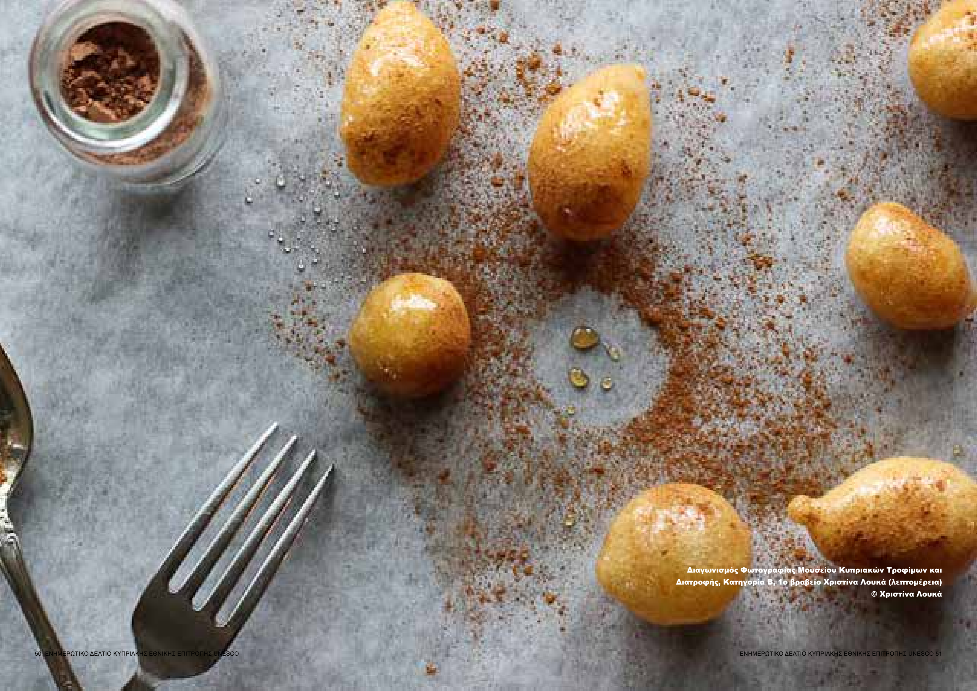
Διαγωνισμός Φωτογραφίας Μουσείου Κυπριακών Τροφίμων και Διατροφής, Κατηγορία Β, 1ο βραβείο Χριστίνα Λουκά (λεπτομέρεια)