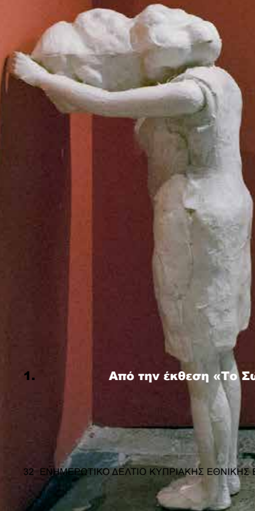
1. Από την έκθεση «Το Σώμα: βιωματικές εμπειρίες στην αρχαία Κύπρο» στο Κυπριακό Μουσείο