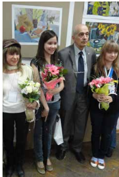
Μέλη της κυπριακής αποστολής