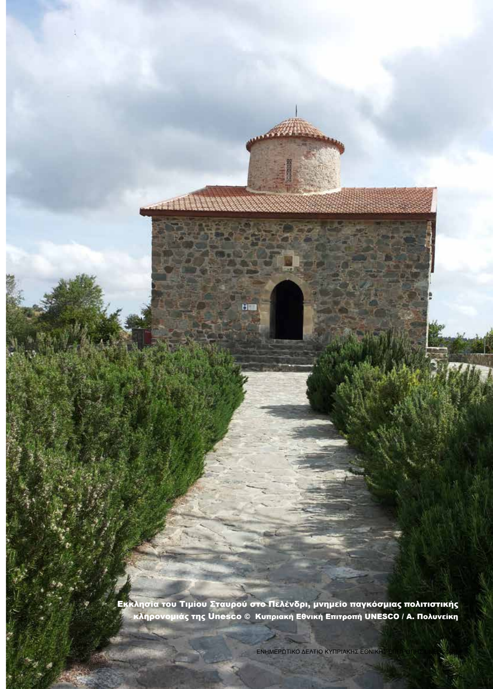
Εκκλησία του Τιμίου Σταυρού στο Πελένδρι, μνημείο παγκόσμιας πολιτιστικής κληρονομιάς της Unesco

Η σημασία της αειφόρου-πράσινης ανάπτυξης, με γνώμονα την προστασία της φυσικής και πολιτιστικής μας κληρονομιάς, υπήρξε το επίκεντρο της εκδήλωσης στην επαρχία Πάφου. Την Παρασκευή 11 Απριλίου 2014 εγκαινιάστηκε η έκθεση «Από τον κόσμο των πουλιών της Κύπρου» στο Κέντρο Επισκεπτών του Αρχαιολογικού Χώρου Κάτω Πάφου. Η έκθεση, που συνδιοργανώνεται με το Λεβέντειο Δημοτικό Μουσείο Λευκωσίας και τον Πτηνολογικό Σύνδεσμο Κύπρου, επιχειρεί να συνδέσει και να ταυτίσει την πανίδα, τα πουλιά της Κύπρου, με τις αναπαραστάσεις τους στην αρχαία κυπριακή τέχνη. Το διαχρονικό ενδιαφέρον και η αλληλεπίδραση του ανθρώπου με το φυσικό κόσμο που τον περιβάλλει πρωταγωνιστεί ως το βασικότερο μήνυμα της έκθεσης και ενισχύει την αδήριτη ανάγκη για πράσινη ανάπτυξη και το χρέος μας να κληροδοτήσουμε τον πολιτιστικό και φυσικό μας πλούτο στις επόμενες γενιές, στα παιδιά μας. Η έκθεση θα φιλοξενηθεί στον χώρο μέχρι τις 31 Ιουλίου 2014.