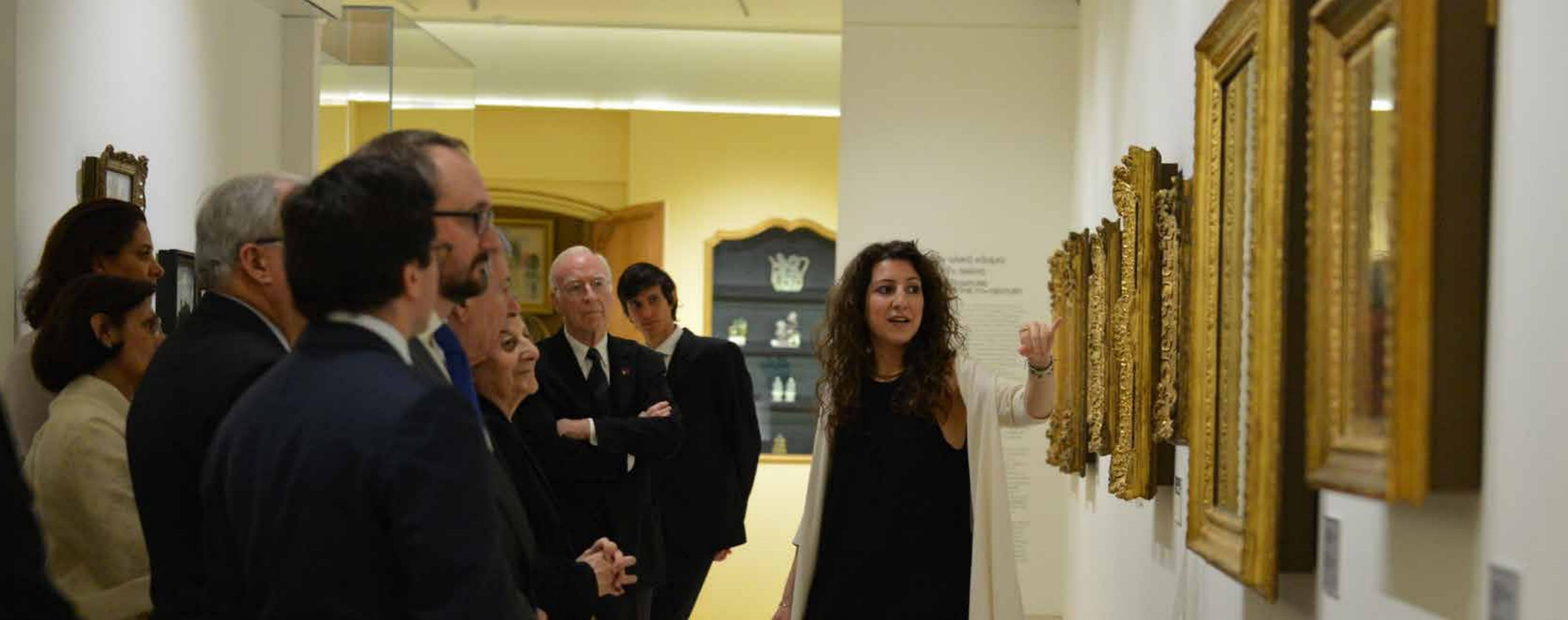
Ξεναγηση στις συλλογές της Λεβέντειου Πινακοθήκης