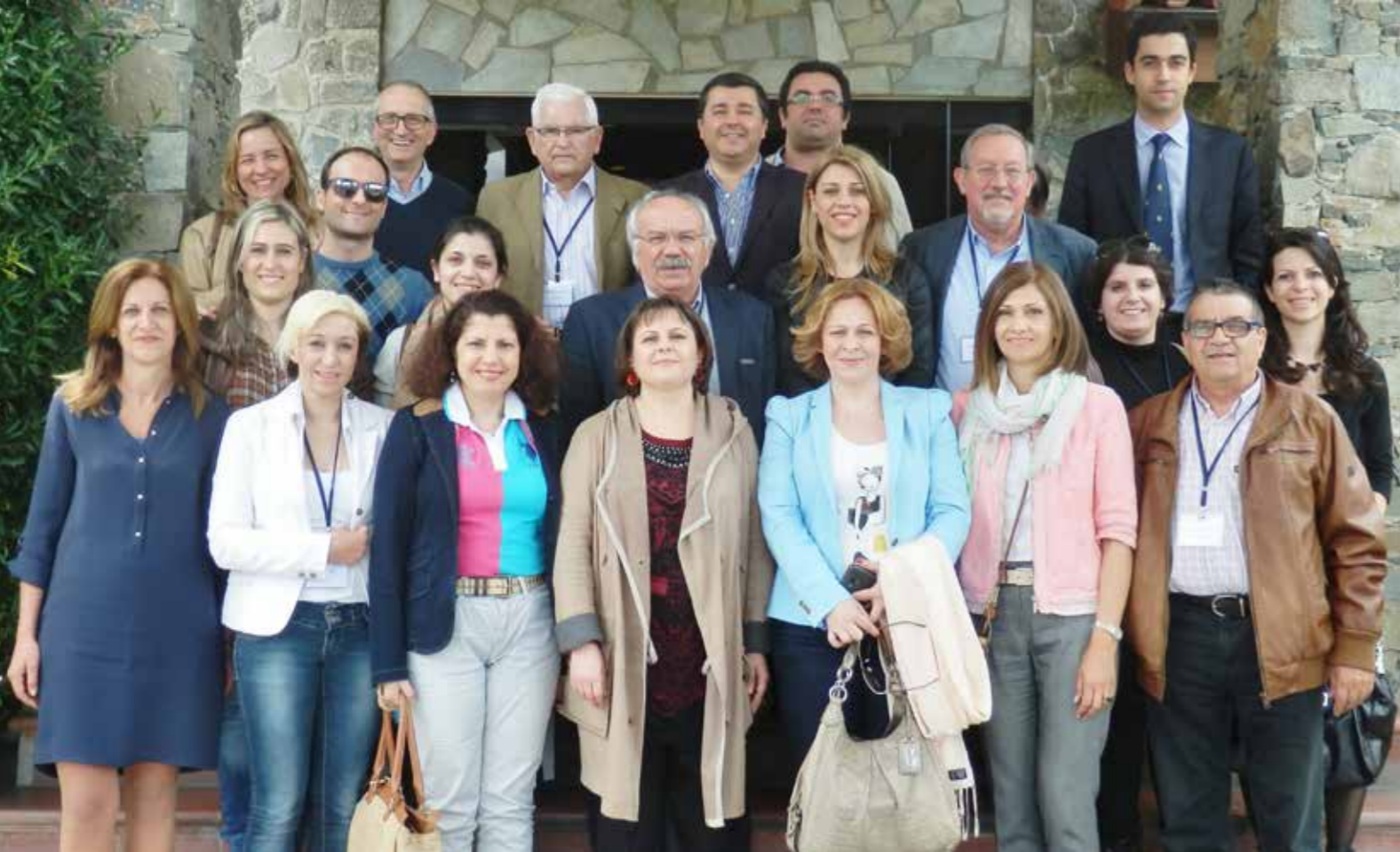
Ομαδική φωτογραφία στο ξενοδοχείο «Ρόδον»