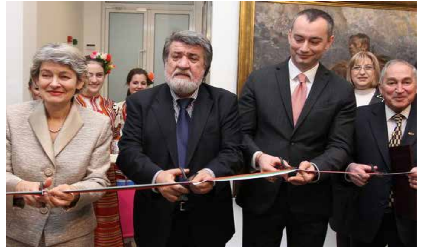
Εγκαίνια του Κέντρου, Φεβρουάριος 2012

Στη διάρκεια του 2013, το Περιφερειακό Κέντρο της