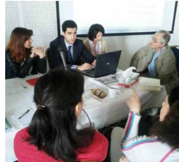
Η ομάδα εν ώρα εργασίας

Π ραγματοποιήθηκε στις 28-29 Απριλίου 2014, στο χωριό Αγρός, συνάντηση εμπειρογνομόνων από τα αρμόδια Υπουργεία και τις εμβληματικές κοινότητες των κρατών που ενέγραψαν την Μεσογειακή Διατροφή στον Αντιπροσωπευτικό Κατάλογο Άυλης Πολιτιστικής Κληρονομιάς της UNESCO. Σκοπός της συνάντησης ήταν η παρουσίαση υφιστάμενων δράσεων και καλών πρακτικών για την προστασία της Μεσογειακής Διατροφής και των τοπικών γαστρονομικών παραδόσεων που αναπτύχθηκαν στις χώρες της Μεσογείου, όπως επίσης και ο καθορισμός τρόπων αποτελεσματικού συντονισμού και ενίσχυσης της συνεργασίας μεταξύ τους.