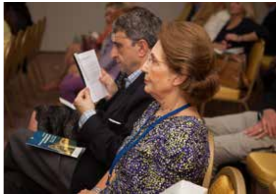
Η Δρ. Ευφροσύνη Ριζοπούλου Ηγουμενίδου

Ριζοπούλου Ηγουμενίδου, Ομότιμη Καθηγήτρια στο Τμήμα Ιστορίας και Αρχαιολογίας του Πανεπιστημίου Κύπρου και εμπειρογνώμονας σε θέματα Άυλης Πολιτιστικής Κληρονομιάς. Οι συμμετέχοντες, πέραν των διαλέξεων, είχαν την ευκαιρία να δοκιμάσουν προϊόντα της Μεσογείου, να ξεναγηθούν στην πόλη του Sibeniik, να παρακολουθήσουν μαγειρικές επιδείξεις και να γευτούν τοπικά κρασιά υπό την καθοδήγηση οινολόγων.