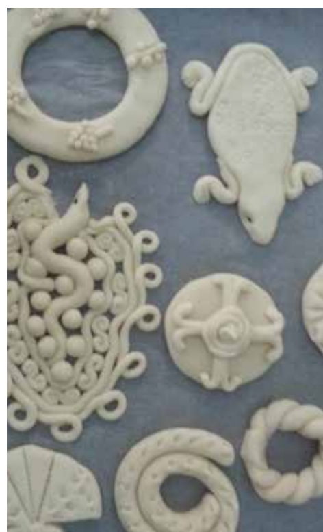
Από την κυπριακή συμμετοχή στις παραδοσιακές τέχνες, «Πλουμιστό Ψωμί της Κύπρου - Ο Κύκλος της Ζωής»

Οι αγώνες συνδιοργανώθηκαν από το Εθνικό Συμβούλιο της Ρωσίας και την κυβέρνηση της επαρχίας Βολγκογκράντ, με τη στήριξη του Υπουργείου Πολιτισμού της Ρωσίας, του Υπουργού Παιδείας και Επιστημών της Ρωσίας, της Ομοσπονδίας Ανεξάρτητων Ενώσεων Εμπορίου, του Συμβουλίου της Ευρώπης, της Ευρωπαϊκής Επιτροπής, της Εκτελεστικής Επιτροπής της Κοινοπολιτείας Ανεξάρτητων Κρατών και της Διακοινοβουλευτικής Επιτροπής της Κοινοπολιτείας. Οι Αγώνες τέθηκαν υπό την αιγίδα της Παγκόσμιας Δελφικής Επιτροπής και της Εθνικής Επιτροπής UNESCO Ρωσίας. Η συμμετοχή της Κύπρου πραγματοποιήθηκε με τη συνεργασία της Εθνικής Επιτροπής Δελφικών Αγώνων Κύπρου και της Κυπριακής Εθνικής Επιτροπής