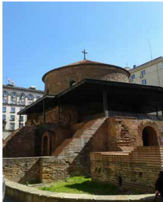
Η Ροτόντα του Αγίου Γεωργίου στη Σόφια