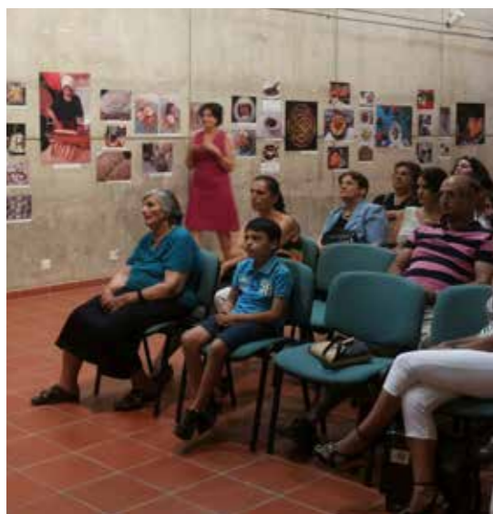
Τελετή Βράβευσης Διαγωνισμού Φωτογραφίας Μουσείου Κυπριακών Τροφίμων και Διατροφής