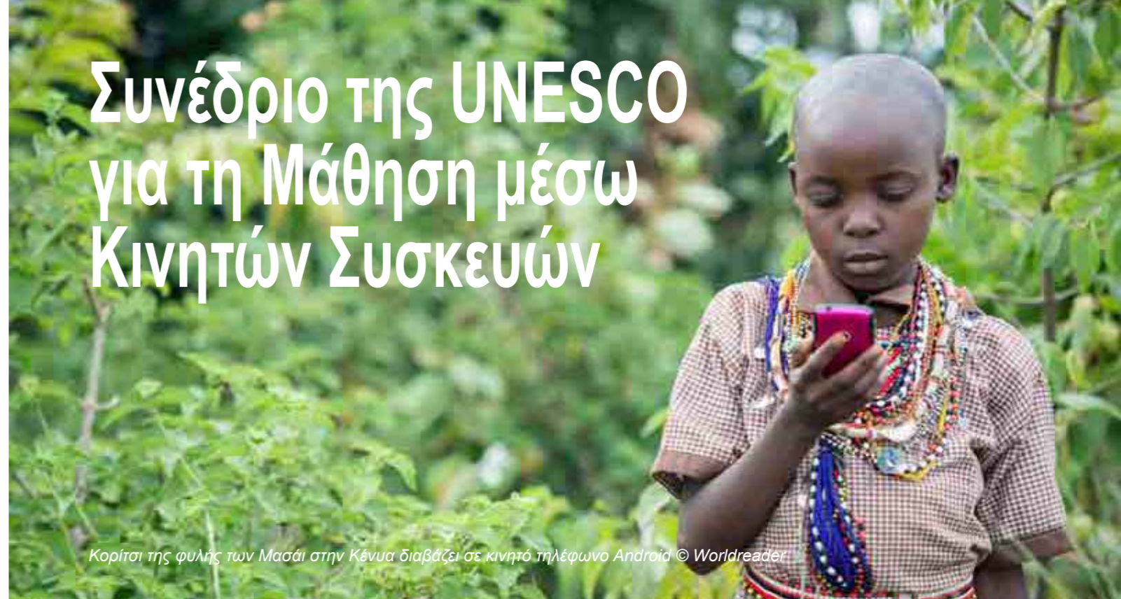
Κορίτσι της φυλής των Μασάι στην Κένυα διαβάζει σε κινητό τηλέφωνο Android

Η Γενική Διευθύντρια του Υπουργείου Παιδείας και Πολιτισμού κυρία Αίγλη Παντελάκη συμμετείχε στο συνέδριο των κυβερνητικών αξιωματούχων για τη Μάθηση μέσω Κινητών Συσκευών, το οποίο διοργανώθηκε από την UNESCO στις 18-20 Φεβρουαρίου 2014, στο Παρίσι.