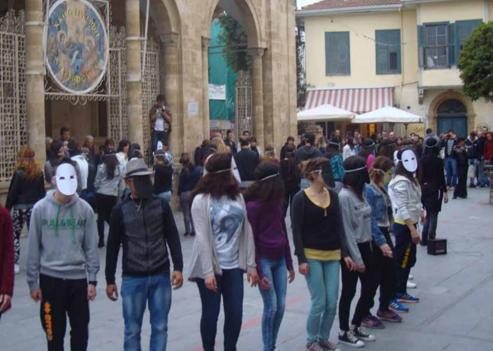
«Antiracism flash mob» στην πλατεία Φανερωμένης στη Λευκωσία, την Κυριακή, 16 Μαρτίου 2014