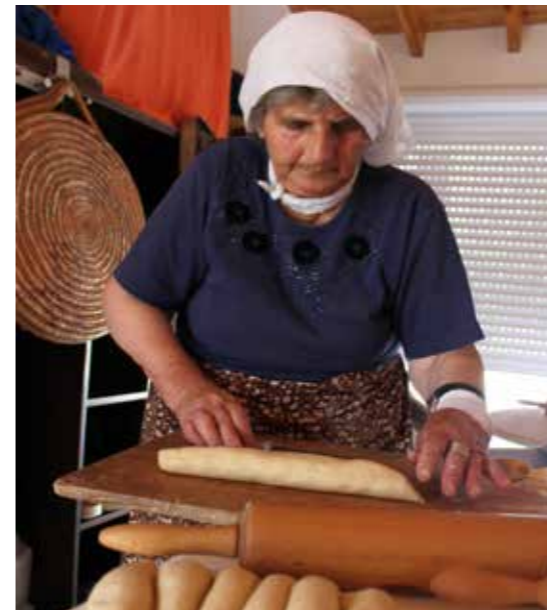
Κατηγορία Α, 2ο βραβείο (λεπτομέρεια) © Γεωργία Θεμιστοκλέους