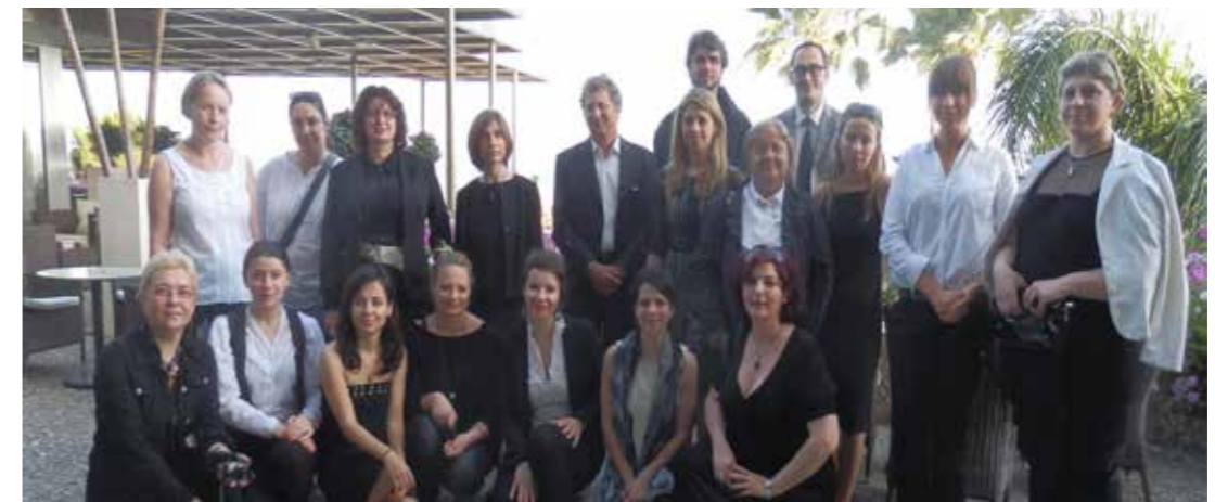
Ομαδική φωτογραφία συνέδρων

Στη διάρκεια της παραμονής τους στην Κύπρο, οι σύνεδροι είχαν την ευκαιρία να ακούσουν ζωντανά το μουσικό σχήμα του πολιτιστικού ομίλου «Αράδιππος», να θαυμάσουν τα περίτεχνα κεντήματα που παρουσίασαν μέλη του Συνδέσμου Παραγωγής και Προβολής Λευκαρίτικου Κεντήματος, να ξεναγηθούν στον αρχαιολογικό χώρο του Κουρίου, να παρακολουθήσουν τις εκδηλώσεις στη Δημοτική Αγορά Λεμεσού στα πλαίσια του προγράμματος MARACANDA – European Historical Markets και να συμμετάσχουν σε χορό μεταμφιεσμένων, που διοργάνωσε ο Δήμος Λεμεσού, με την ευκαιρία της πραγματοποίησης του 34ου Συνεδρίου Ευρωπαϊκών Καρναβαλικών Πόλεων.